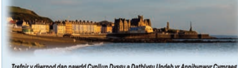
Trefnir y diwrnod dan nawdd Cynllun Dysgu a Datblygu Undeb yr Annibynwyr Cymraeg